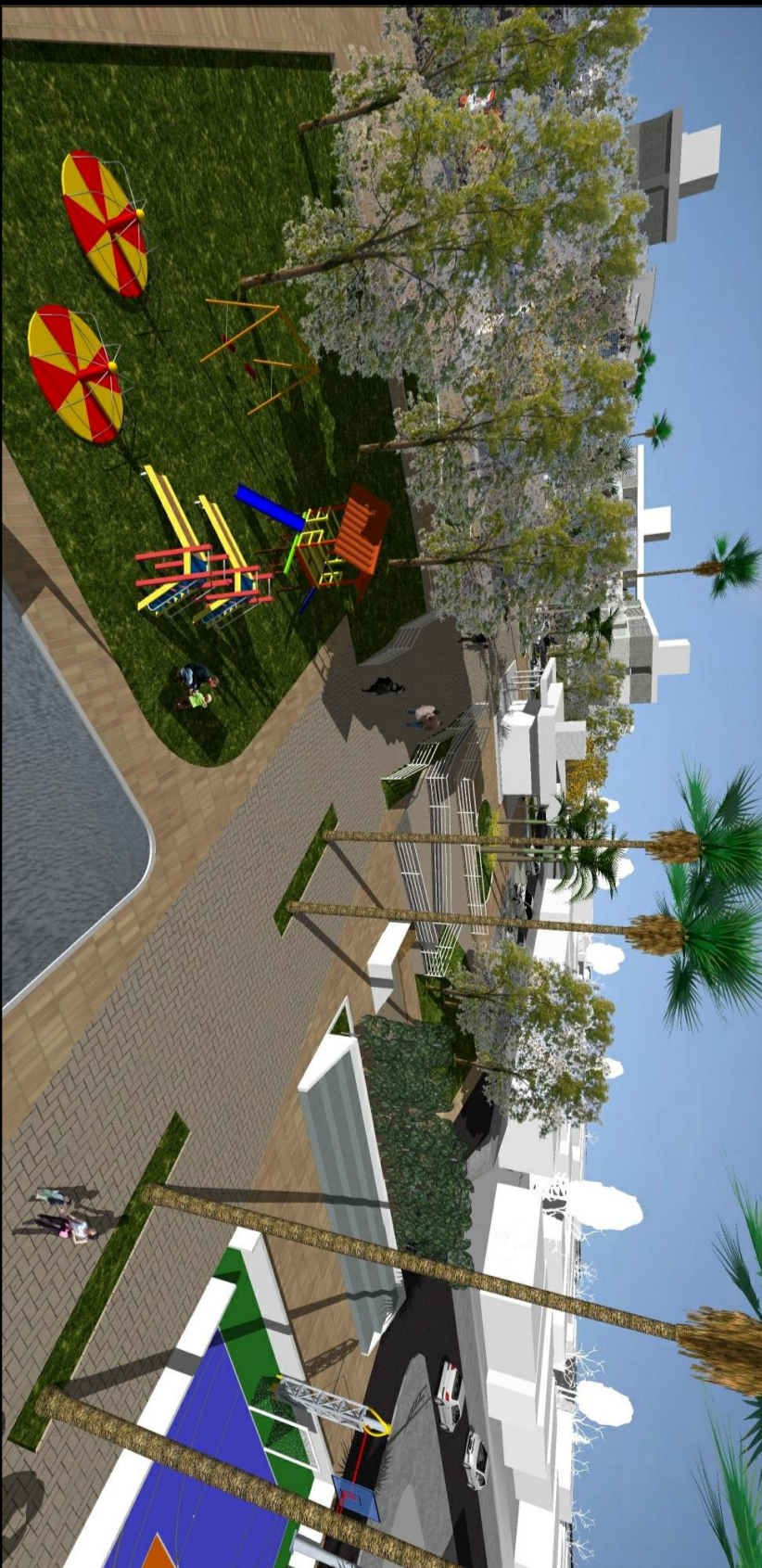
Vista da área de lazer, mostrando em seguida o posto de saúde, o centro comunitário e os blocos habitacionais.