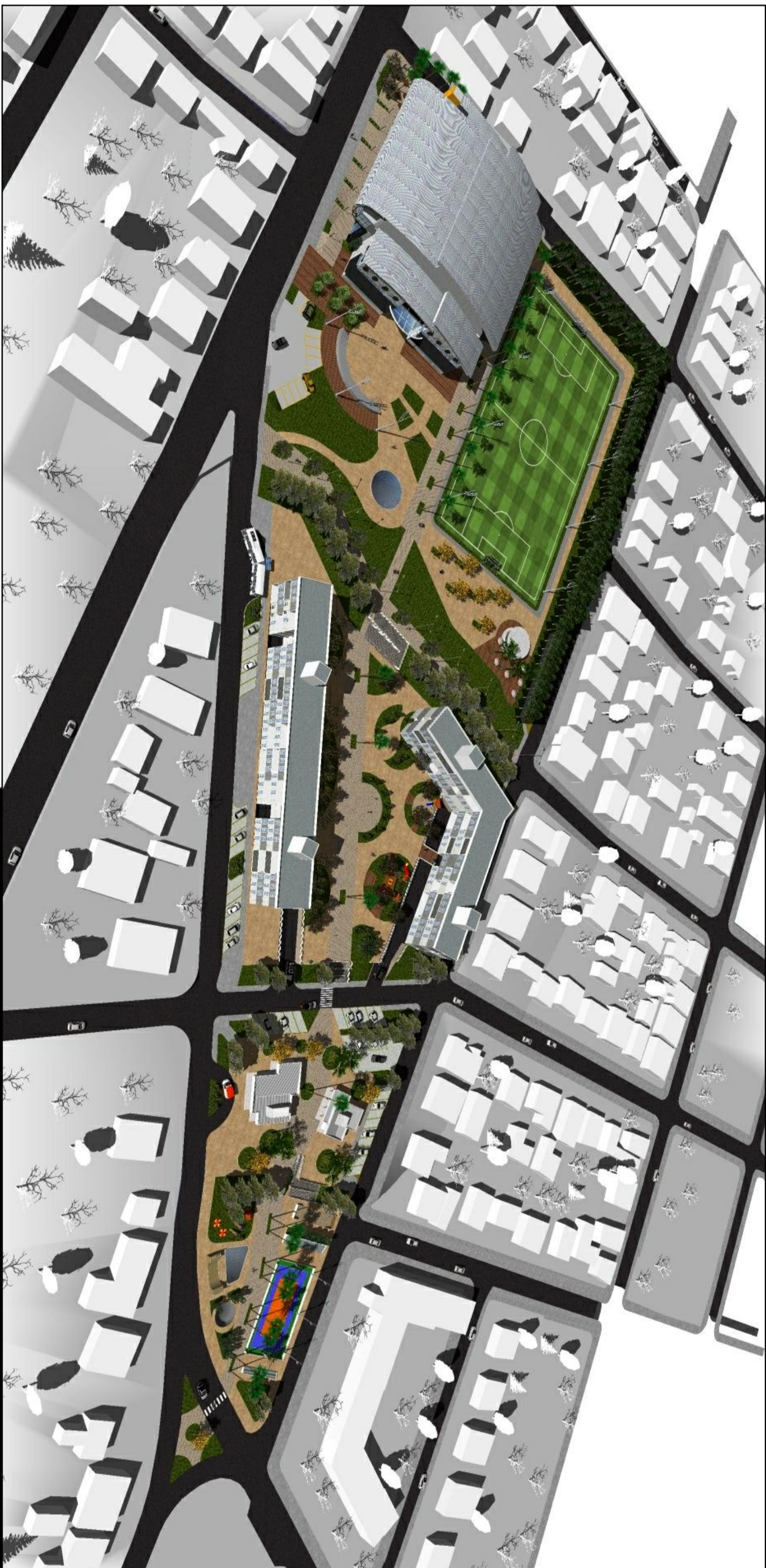
Visão Geral da Implantação.