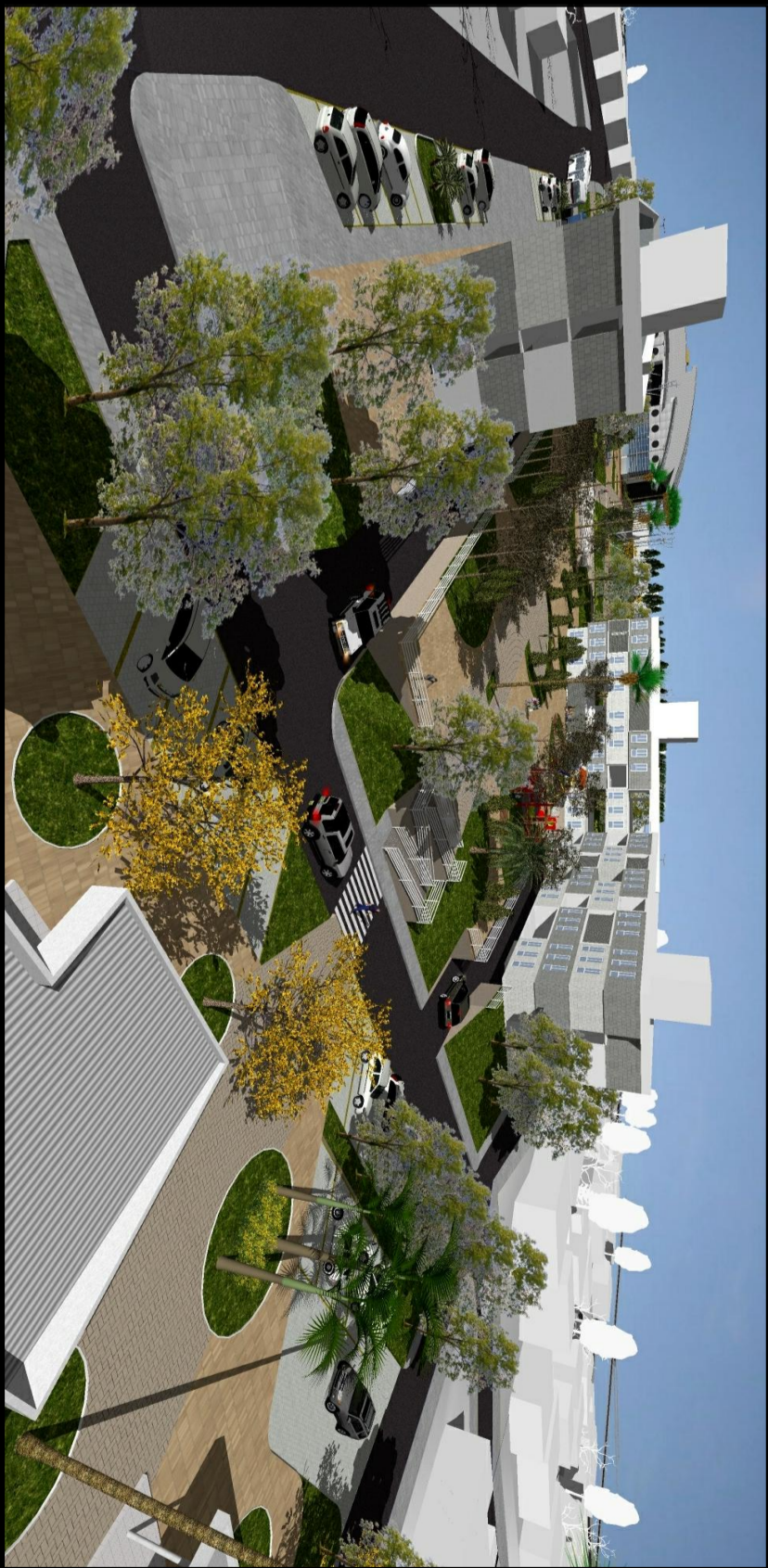
Visão Geral da Implantação, mostrando área Institucional, Habitacional e vista do Complexo Esportivo.